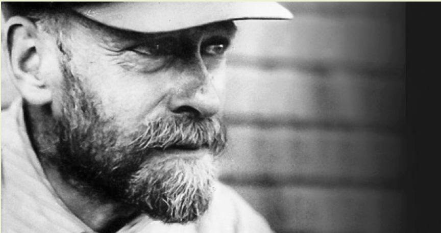
Janusz Korczak 1934

You know, everyone makes so much of Korczak's last decision to go with